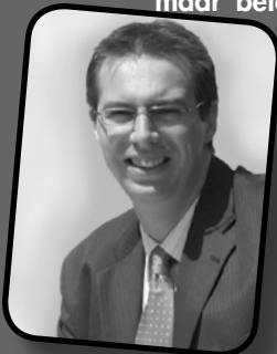
Geert De Backer Fractievoorzitter Vlaams Belang

Kwestie om de waarheid aan te geven zonder geweld te doen?