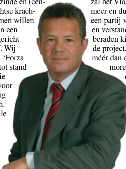
Frank Vanhecke Voorzitter Vlaams Belang

Zo kan het niet langer. De verkalkte Waalse PS-staat blokkeert Vlaanderen, en is een bedreiging voor Vlaamse jobs en Vlaamse welvaart. Daarom wil het Vlaams Belang een breed front tot stand brengen dat de verdediging van de Vlaamse belangen centraal stelt. Wij reiken de hand aan alle Vlaamsgezinde en (centrum-) rechtse krachten die samen willen werken aan een toekomstgericht alternatief. Wij willen een 'Forza Flandria' tot stand brengen die eindelijk voor verandering kan zorgen. Los van alle mogelijke meningsverschillen moet